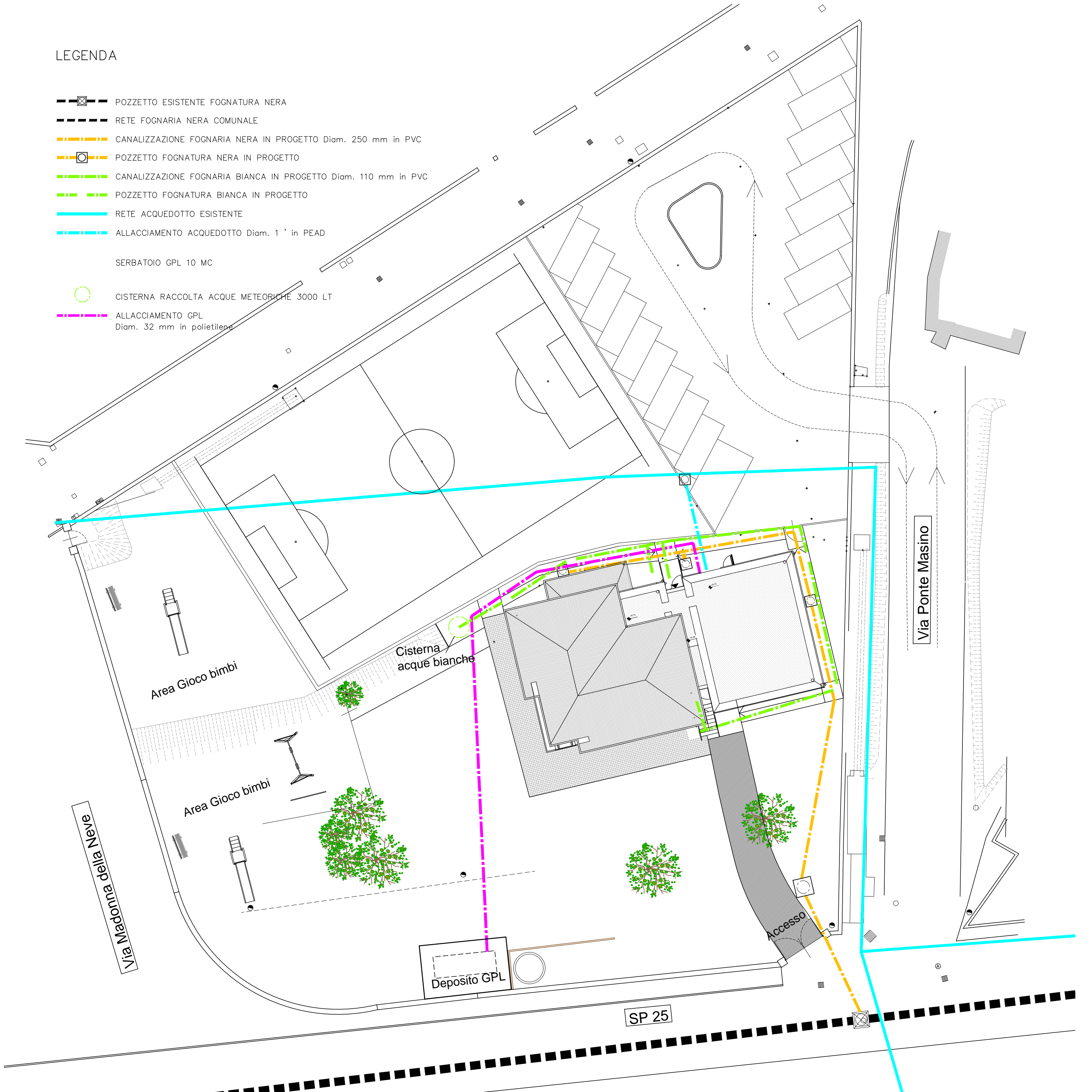
Planimetria Allacciamenti sottoservizi Scala 1:200