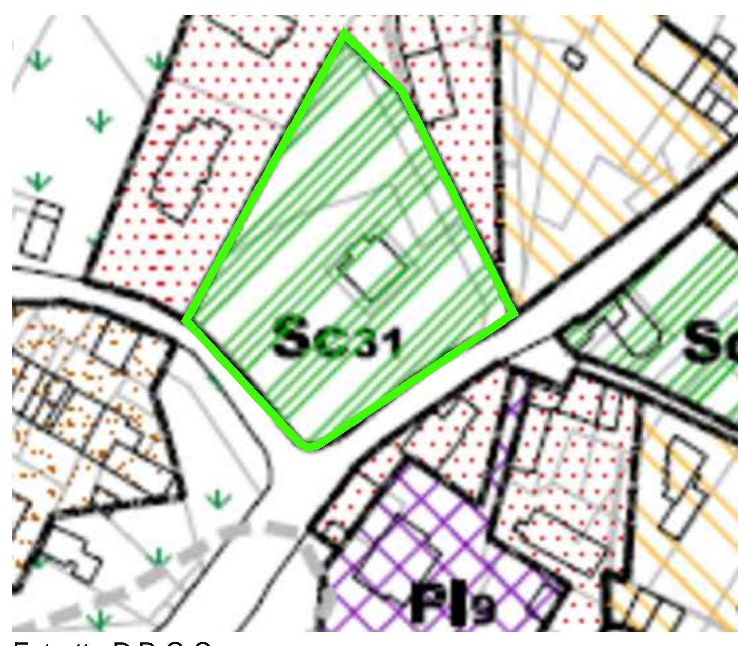
Estratto P.R.G.C Scala 1:1000