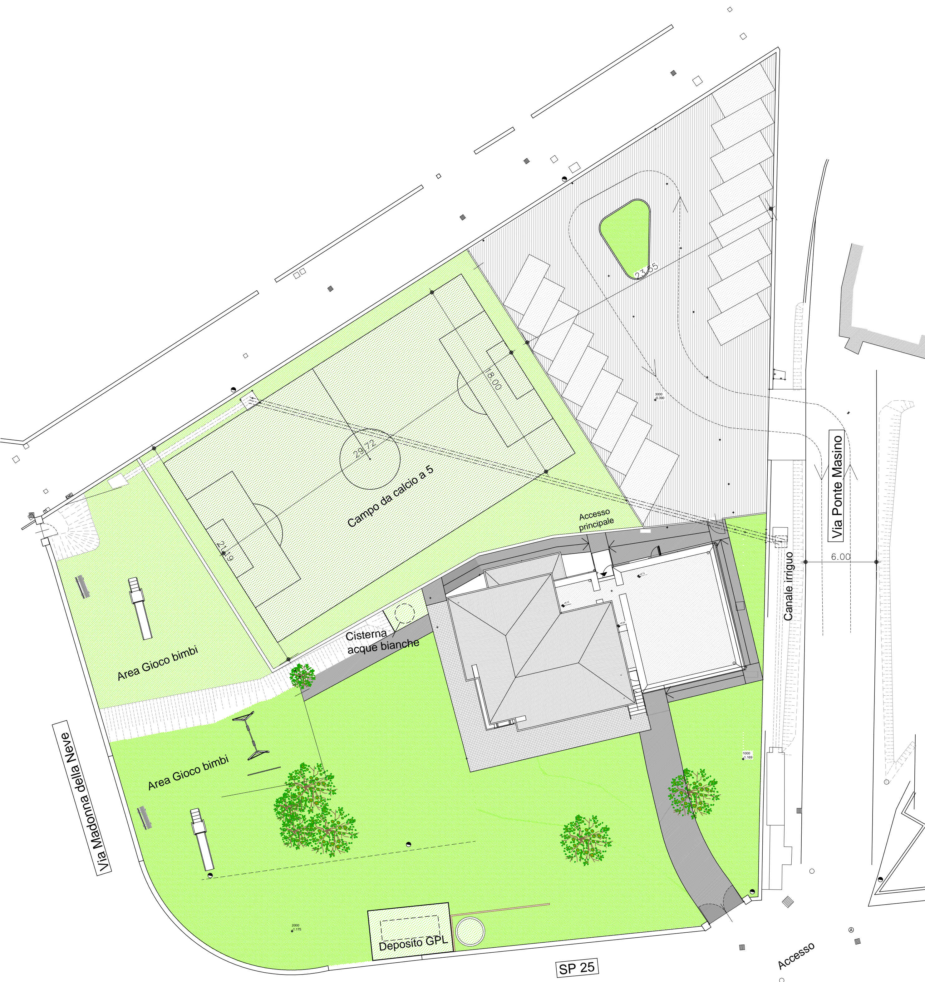
Planimetria Progetto Scala 1:200