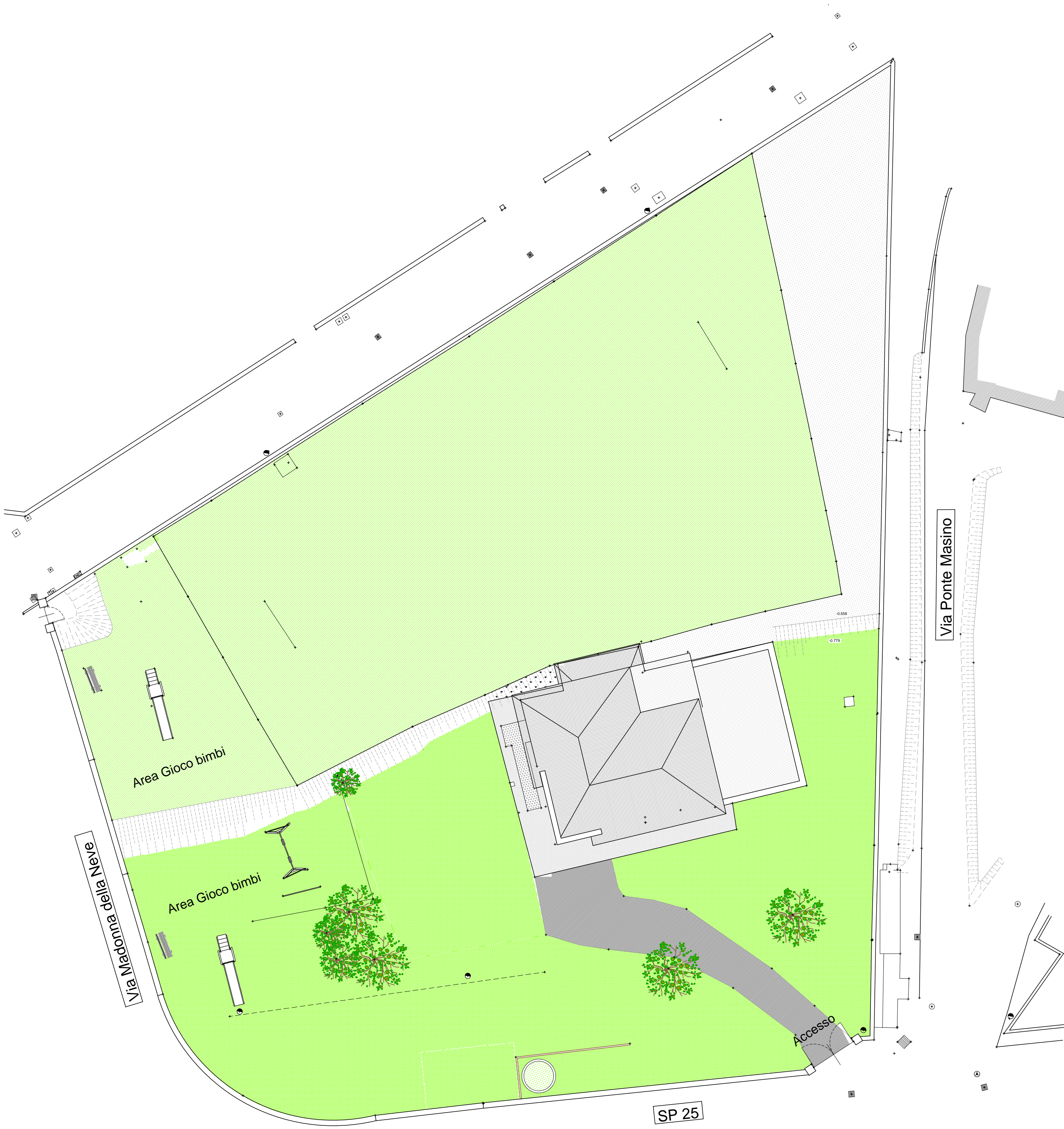
Planimetria stato di fatto